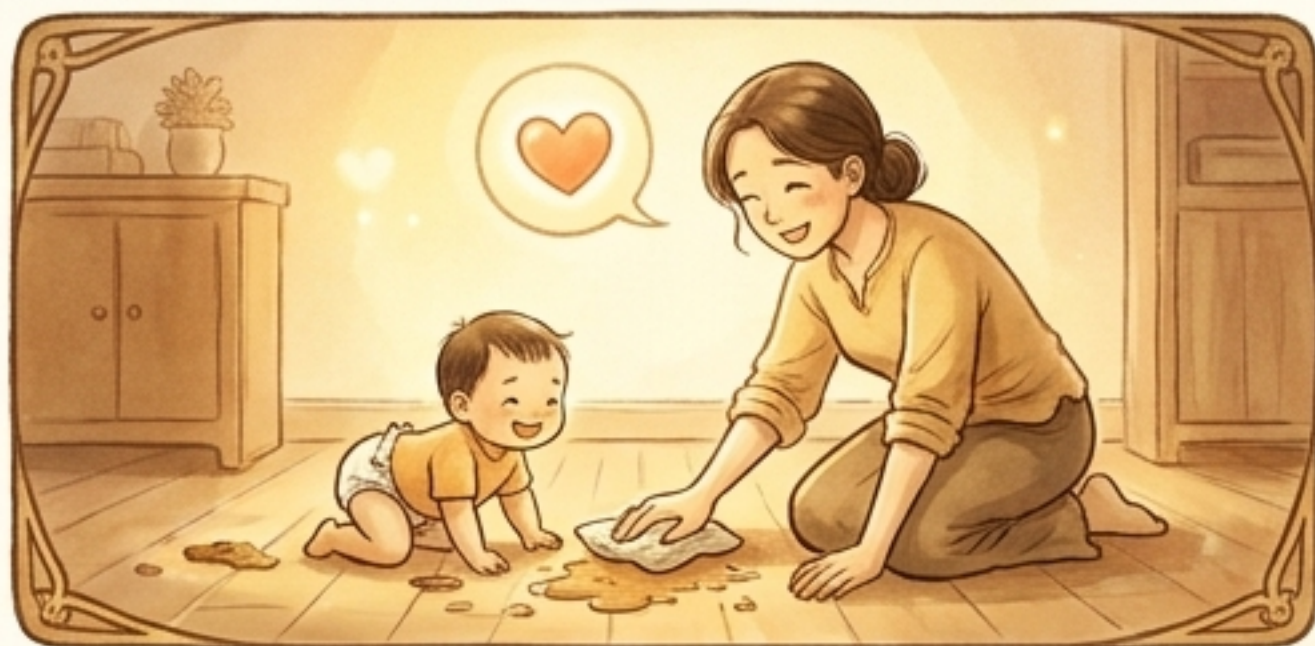
徒手擦拭屎尿，毫無厭煩