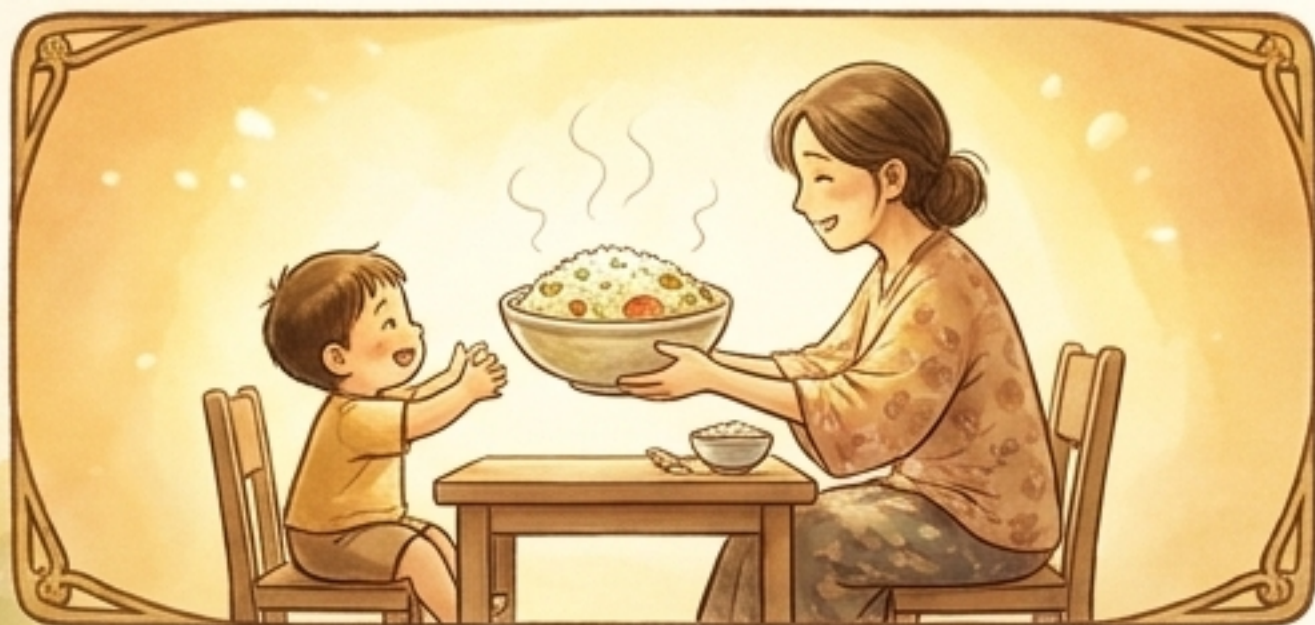
把最好的都留給你