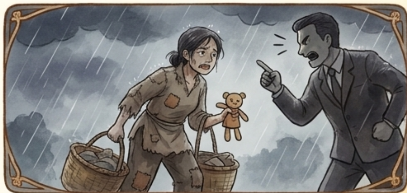
為了你，甘願承受世間的艱辛與惡名